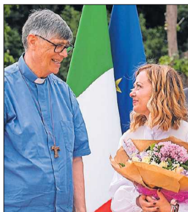
Italiens Ministerpräsidentin Meloni im Gespräch mit Don Maurizio. Der Priester aus Caivano ist dort in den Problemvierteln unterwegs.

Im vergangenen Jahr wurden in ganz Italien über 800 Bandenmitglieder verhaftet; in 70 Prozent der Fälle handelte es sich um Immigranten der zweiten oder dritten Generation. Fast