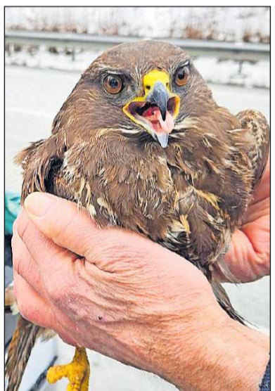
Der Bussard wurde bei dem Unfall im Kühlergrill eingeklemmt, aber nur leicht am Flügel verletzt.

MÖNKHAGEN. Mit nur einer leichten Verletzung am Flügel hat ein Bussard die Kollision mit einem Auto auf der A20 bei Lübeck überlebt – und das, obwohl er dabei im Kühlergrill eingeklemmt wurde.